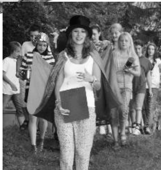
Eindrücke von der Kinderfreizeit 2011