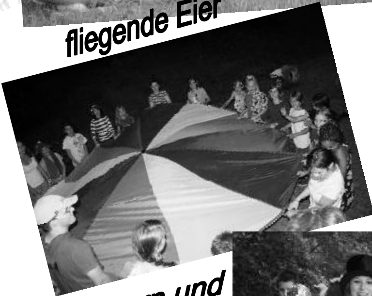
Popcorn und Seifenblasen